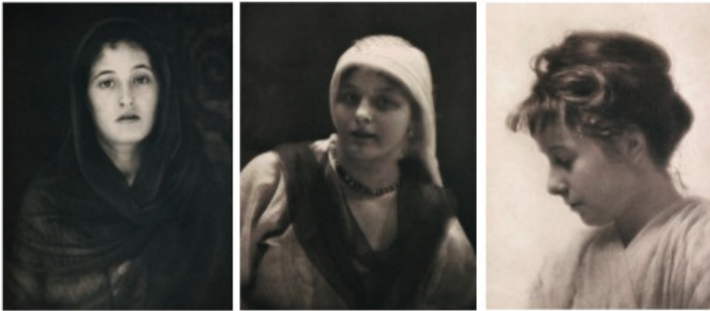
Linked Ring. Pictorial Photographs: A Record of the Photographic Salon